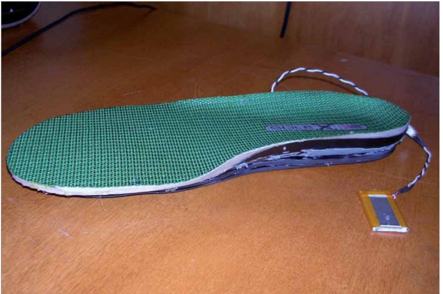
> La iShoe collegata al rilevatore

Se si è quindi in grado di monitorare lo stato in cui versano le capacità di sostegno della persona in un dato momento, si possono raccogliere dati lungo un determinato arco di tempo per poi poter stabilire il modo in cui tale capacità si è evoluta ed eventualmente dare inizio ad un trattamento di prevenzione e di recupero delle facoltà di deambulazione da parte dei medici.