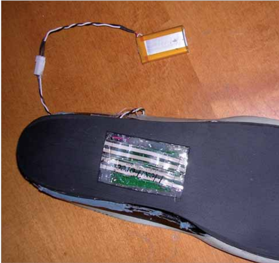
> Parte inferiore della "suola intelligente"

superfici che sostengono il peso, come le piante dei piedi.